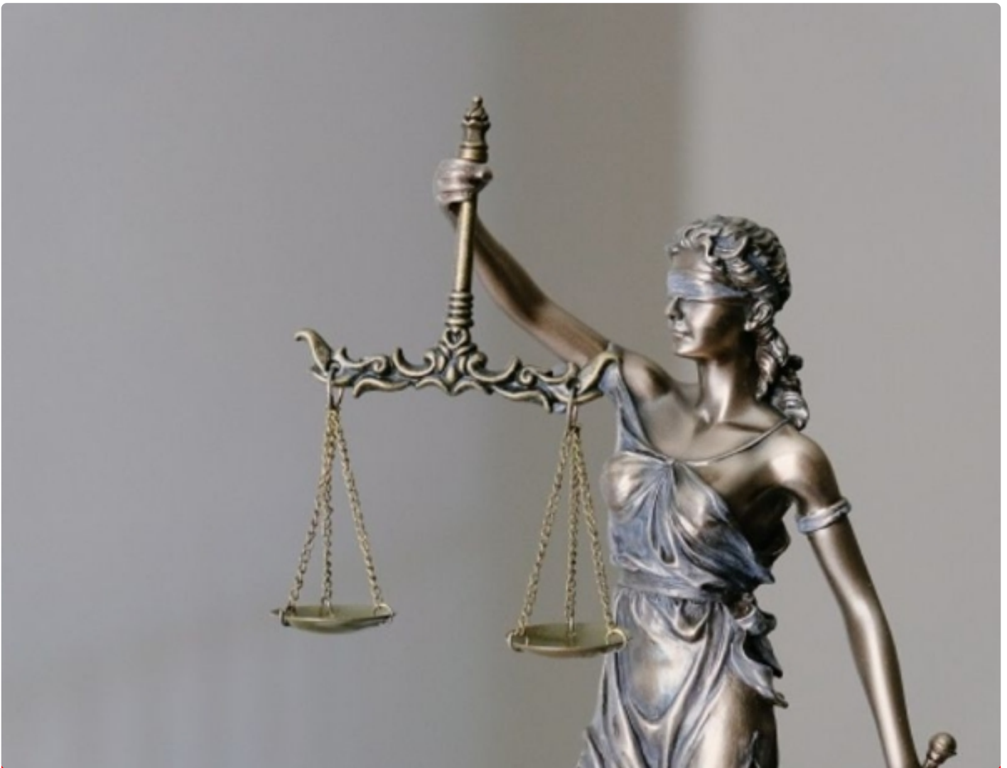
Gambar Ilustrasi Dewi Keadilan