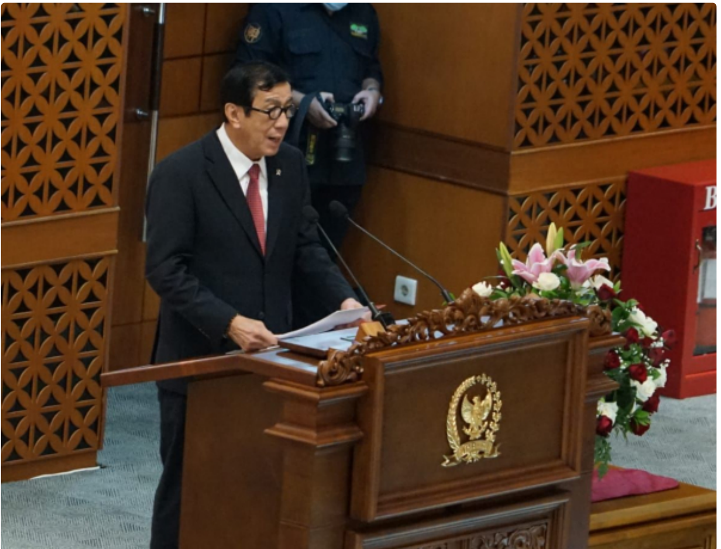
Menkumham Yasonna Laoly: UU Pemasyarakatan untuk Perkuat Keadilan Restoratif

JAKARTA – Menteri Hukum dan HAM Yasonna H. Laoly mengapresiasi semua pihak yang berperan dalam pengesahan Rancangan Undang-Undang tentang