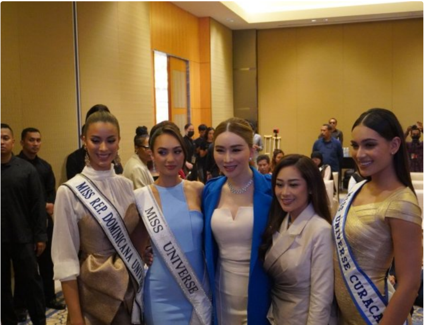
Anne Jakapong Jakrajutatip, CEO JKN Global Group PCL (Pemilik Organisasi Miss Universe), sekaligus Penasihat Senior Miss Universe Indonesia, baju biru tengah.

NUSA DUA - Miss Universe Indonesia telah memasuki babak baru di tahun 2023. Organisasi ini kini berada di bawah pimpinan PT Capella S. Karya dan akan melaksanakan rangkaian acara grand opening yang akan diselenggarakan di Bali pada tanggal 19-23 Februari 2023, Selasa (21/02/2023).